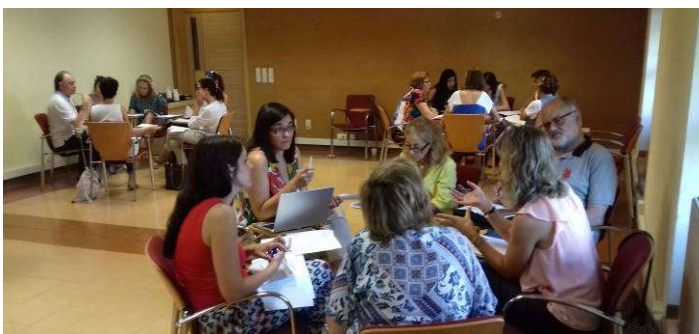
Taller 2. 18 de julio

Además de los talleres presenciales, se da la posibilidad de hacer aportaciones al borrador del Plan a través de un foro online abierto en la web de Aragón Participa del 6 al 25 de julio y también enviando informes detallados al mail: aragonparticipa@aragon.es .