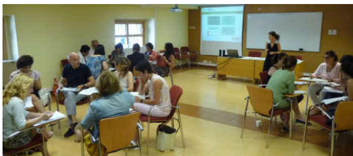
Taller 1. 13 de julio

El debate sobre los ejes se distribuye en dos talleres en el mes de julio. El primero, que aborda los ejes 1 y 2, se desarrolla el 13 de julio y, cinco días más tarde, el 18 de julio tiene lugar el segundo taller en el que se trabajan los ejes 3 y 4.